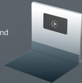
B 180 x H 150 x T 10 mm (mit USB)